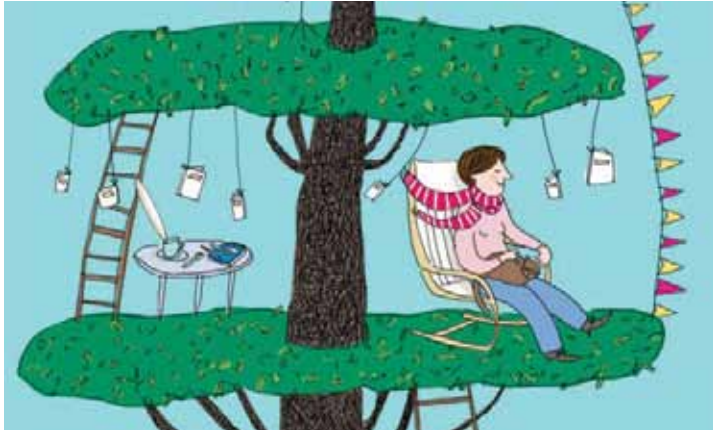
IRENE PENAZZI - ITACA... CONTEST 2012